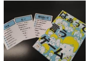
↑ そらいろで人気のカードゲーム ↓